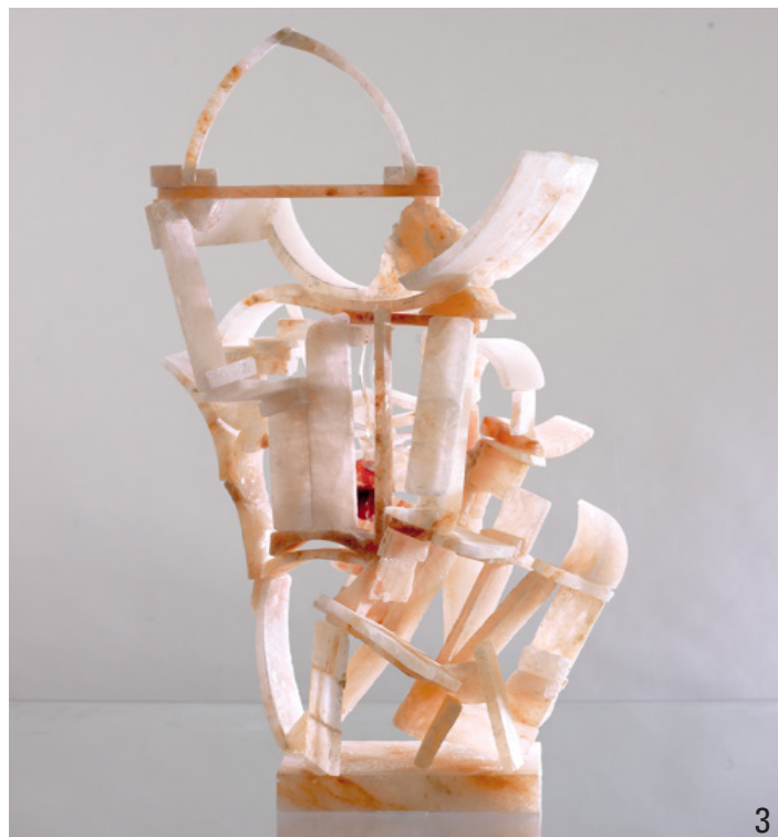
chantalpetit, petit palmyre, sculpture en sel d'Himalaya, 2018