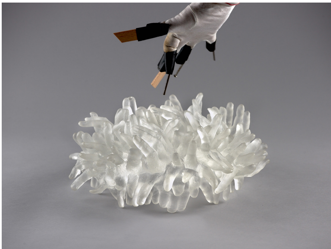
chantalpetit, physis, sculpture en verre, 2009

Son œuvre fait partie de collections publiques et privées - FNAC, Musée national d'art moderne, musée d'art moderne de Stockholm, collection Antoine de Galbert etc... - et est présentée régulièrement en France et à l'étranger, notamment à La maison rouge, au FRAC Picardie, au musée d'art moderne de Saint Lô, au Bonnefantenmuseum de Maastricht.