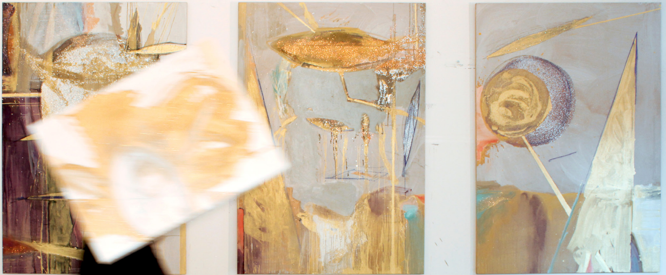
chantalpetit, vue d'atelier, 2016

CONTACT PRESSE : Léa Egrelon - 01 49 86 99 14 lea.egrelon@legenerateur.com