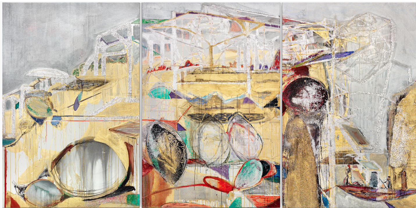
chantalpétit, Seul dans la splendeur , huile sur toile, 2017

L'exposition-performance met en mouvement ces huit grands polyptiques dans l'espace du Générateur.